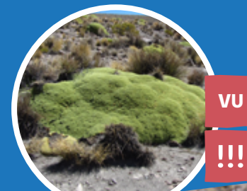
LLARETA Azorella compacta