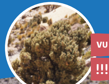
QUEÑOAL DEL ALTIPLANO Polylepis tarapacana