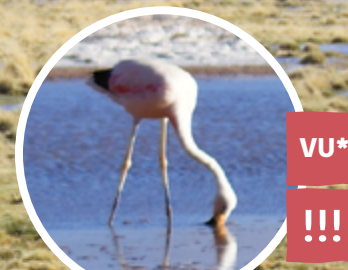
PARINA o FLAMENCO CHILENO Phoenicopterus chilensis *entre las regiones de Arica y Parinacota y Atacama