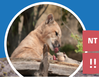
PUMA Puma concolor