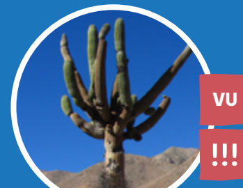
CACTUS CANDELABRO Browningia candelaris

En la precordillera del Norte Grande, existen plantas nativas como los cactus, y animales como guanacos y tarucas (venado andino). Mientras que en el Altiplano hay varias agrupaciones vegetales conocidas como bofedal, pajonal, tolar, llaretal y queñoal. Estas plantas permiten la vida de animales como alpacas y llamas.