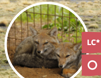
ZORRO CULPEO Lycalopex culpaeus *salvo en Tierra del Fuego