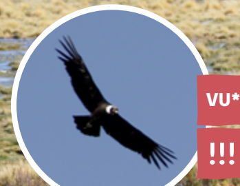
CÓNDOR Vultur gryphus *entre las regiones de Arica y Parinacota y del Maule