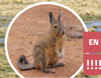
VIZCACHA Lagidium viscacia